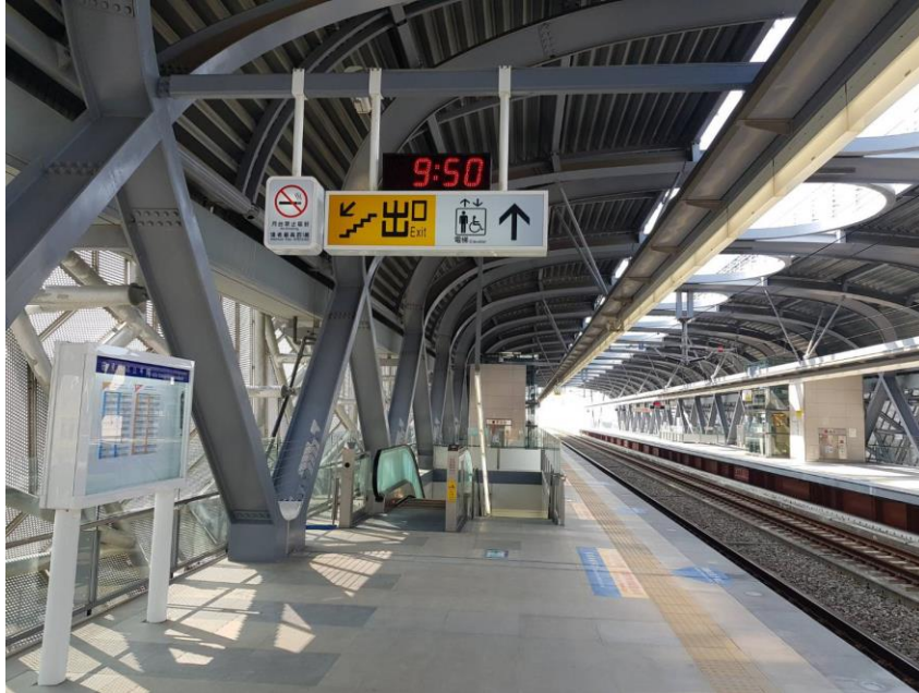
圖1 臺中花博_后里站外觀