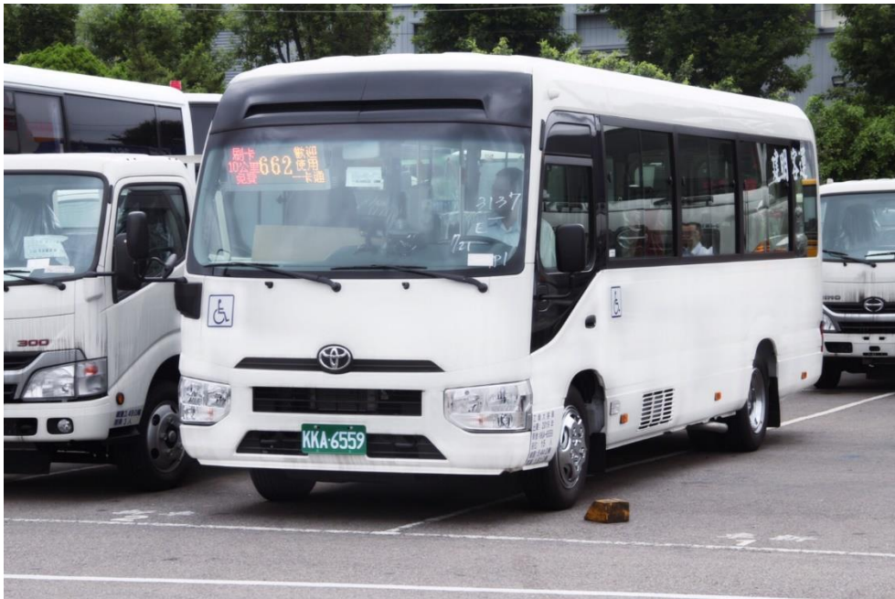
圖1 無障礙甲類大客車

三、補助無障礙乙類大客車縣市為臺中市 3 輛、臺南市 3 輛、宜蘭縣 2 輛、花蓮縣 1 輛。