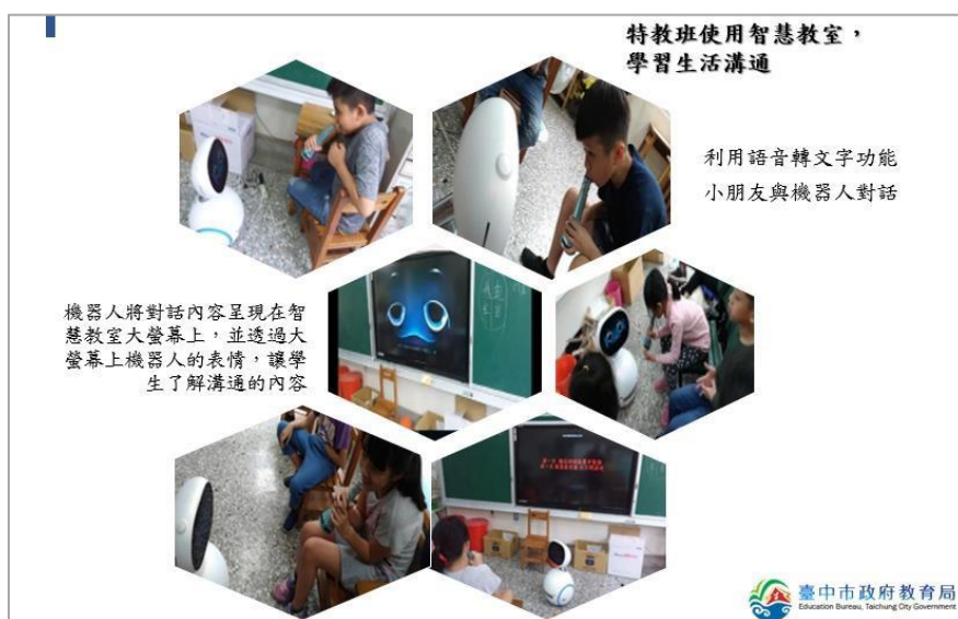
▲大鵬國小榮獲教學創新類特殊教育組標竿學校