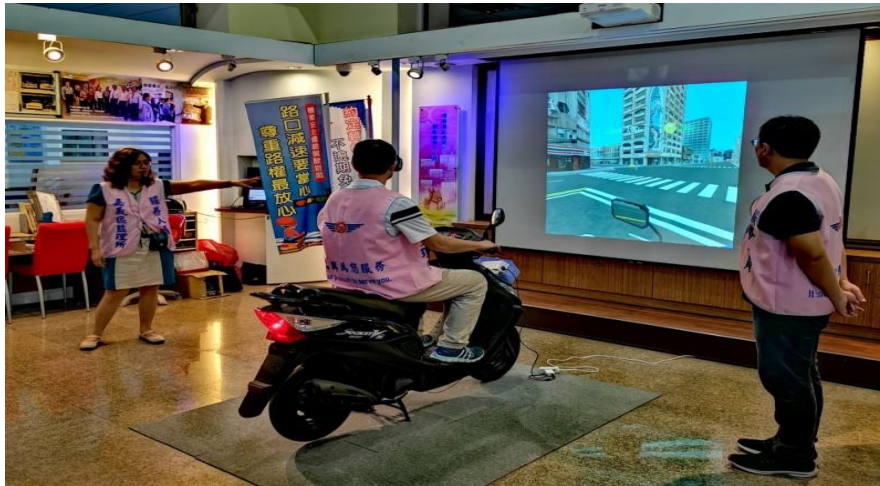
圖1 大學課程融入機車實境教學