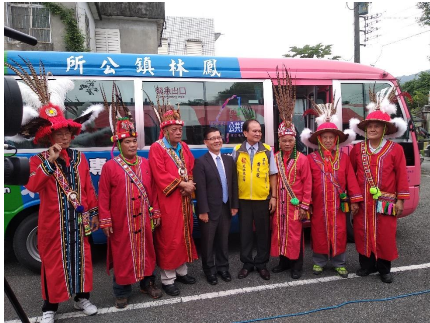
圖1 花蓮鳳林幸福巴士