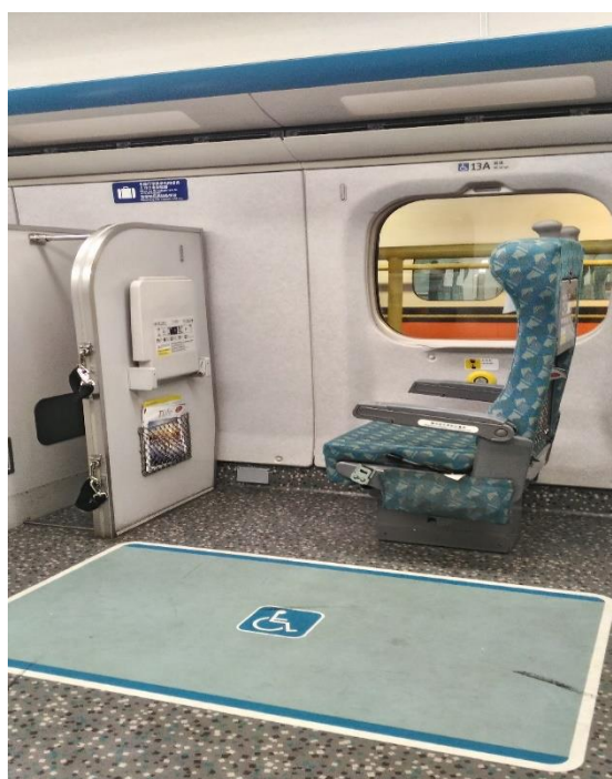
圖2 台灣高鐵列車殘障座位_增設充電插座(2)