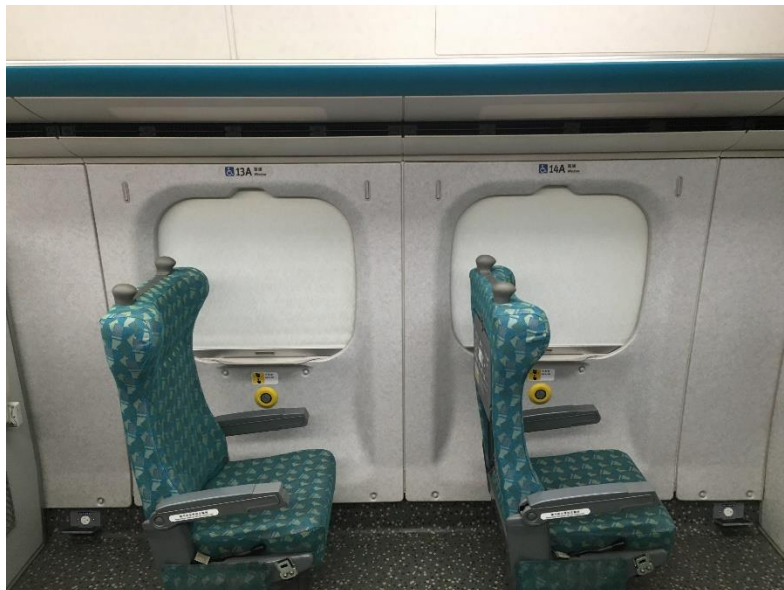
圖1 台灣高鐵列車殘障座位_增設充電插座(1)

四、乘坐輪椅及行動不便的旅客，則可透過客服專線或親臨車站售票窗口預訂無障礙座位，在高鐵各站亦設有電梯及停車位，方便旅客順利搭乘。另為方便使用電動輪椅之旅客，能隨車充電需求，於每列車第7節車廂無障礙座位增設電動輪椅充電插座。