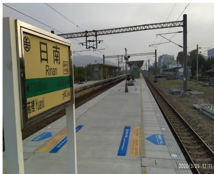
圖1 日南站月台齊平

潭子站、頭家厝站、松竹站、太原站、精武站、臺中站(圖2)、五權站、大慶站、左營站、內惟站、美術館站、鼓山站、三塊厝、高雄站、民族站、科工館站、正義站、鳳山站等40站。