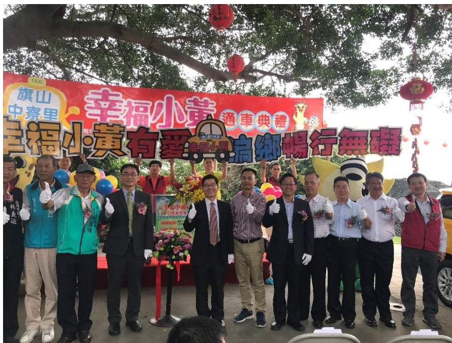
圖2 高雄旗山幸福小黃