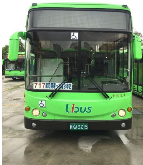
圖2 無障礙乙類大客車