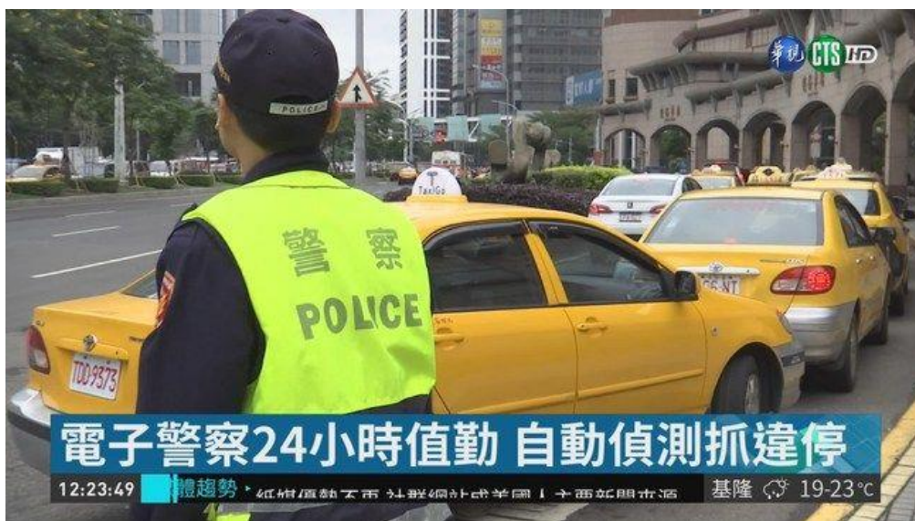
圖2 板橋車站啟用違規停車自動取締