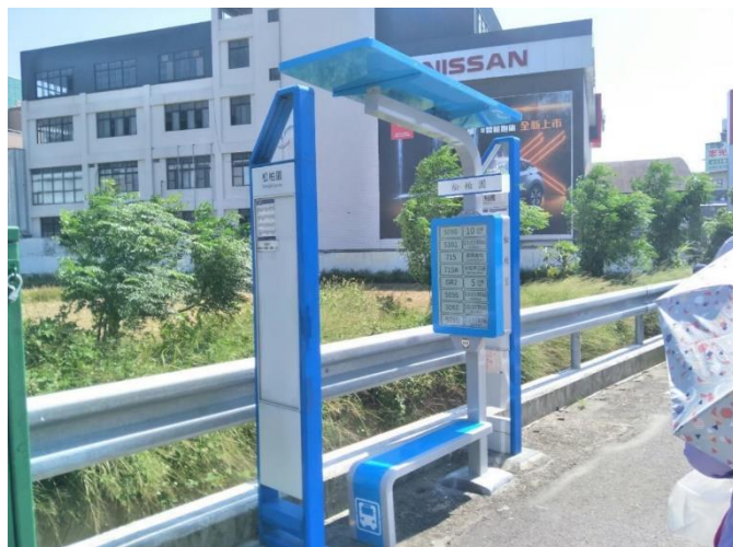
圖1 桃園電子紙站牌-松柏園