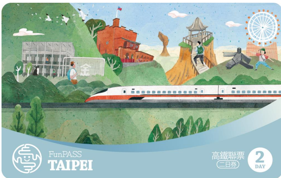
圖1 「高鐵+北北基好玩卡」交通聯票搭配都市彩繪風格之好玩卡