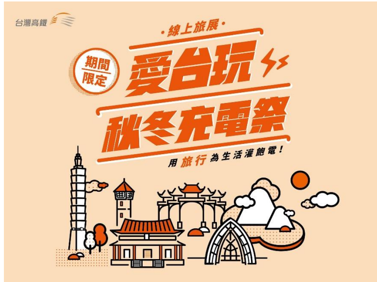
圖2 台灣高鐵線上旅展主視覺