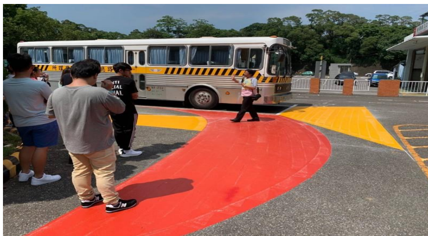
圖2 監理所內輪差體驗活動