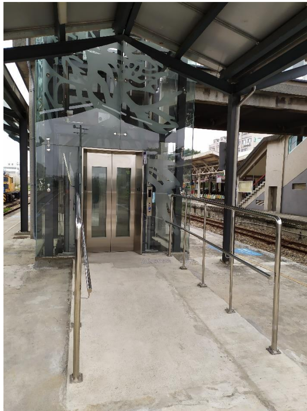
圖1 竹東站一月台電梯

2019年配合鐵路行車安全改善六年計畫（104年~111年），原欲發包多站電梯建置（如白沙屯站、日南站、龍井站、烏日站、大肚站等），然因多地處偏遠地區，發包不順利，造成多次流標，故僅完成建置竹東站電梯（圖1、圖2）。