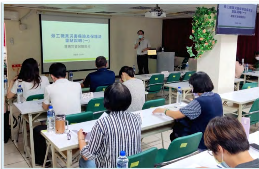
強化勞工職業災害保險及保護法之宣導

「勞工職業災害保險及保護法」於 2021 年 4 月 30 日公布，預定自 2022 年 5 月 1 日施行，勞動部刻正辦理相關授權子法研訂、行政籌備及各項資訊作業系統之建置作業，以利新法順利上路施行。