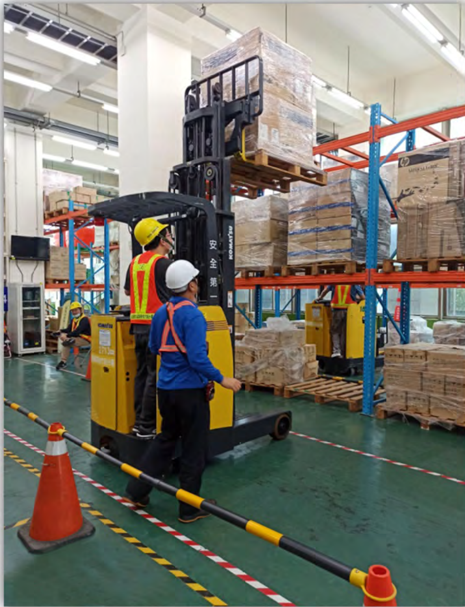
實務操作堆高機教學