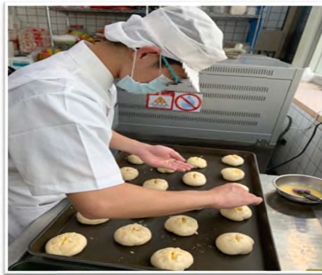
阿強說「會珍惜這份工作，做更多好吃的給大家」