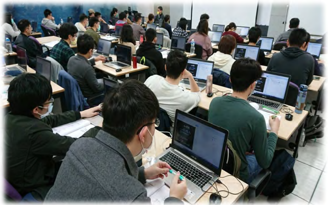
產業新尖兵試辦計畫數位資訊課程上課情形

2. 勞動部青年職涯發展中心 2020 年服務青年 17 萬 5,870 人次；2021 年 1 月至 11 月服務青年 16 萬 3,301 人次。