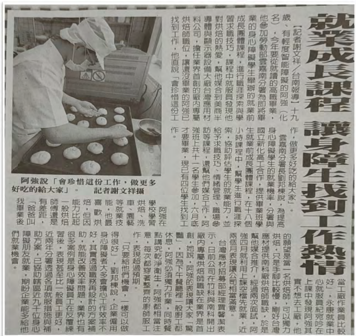
2021年6月身心障礙就業前團體成長課程新聞

2020年及2021年1月至11月辦理就業前成長團體共計103場次，規劃職涯探索、職場互動及求職技巧等主題課程，提升身心障礙者就業認知，參加地方政府及高中職、大專校院就業轉銜會議共計54場次，並導入職務再設計排除身心障礙者就業障礙。