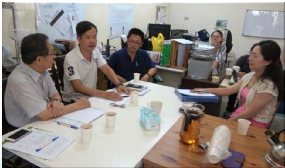
個別化創業協助方案創業專家個別輔導情形