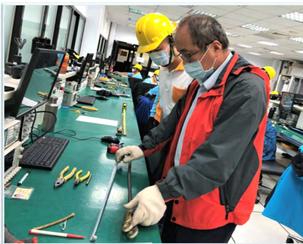
升降機裝修-鋼索基礎實習