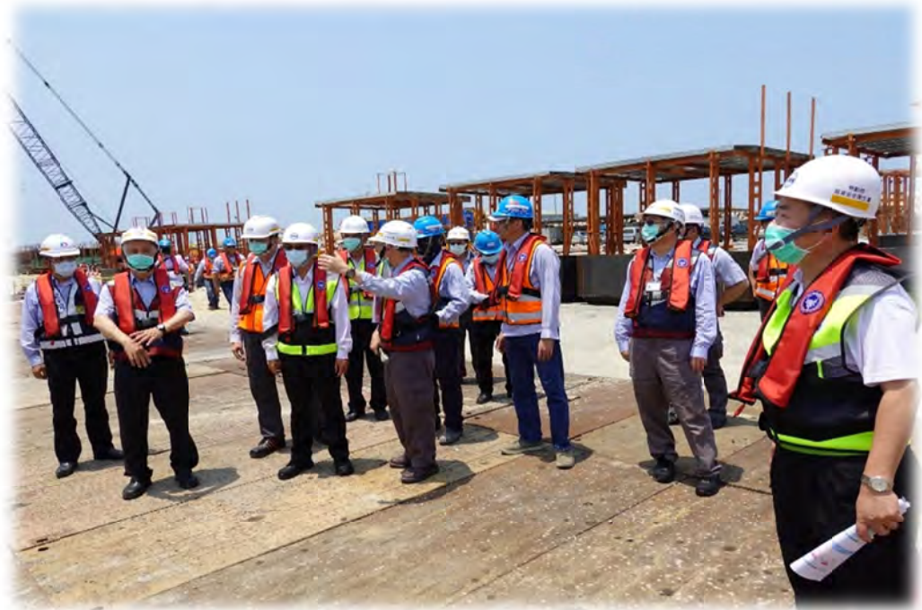
勞動部會同經濟部及新北市政府跨部會聯合督導台灣中油股份有限公司之「第三座天然氣接收站建港及圍堤造地新建工程」

透過每季召開之平台會議，討論精進各項減災作為，相關部會積極展開所屬工作，2021 年共計完成公共工程相關勞動監督檢查 21,817 場次，跨部會聯合檢查 72 場次，統計營造業工作場所重大職災死亡人數已較 2018 至 2020 年同期之平均值降低 8.22%。