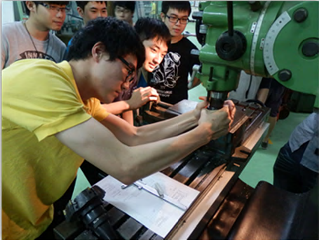
雙軌訓練旗艦計畫工作崗位訓練情形