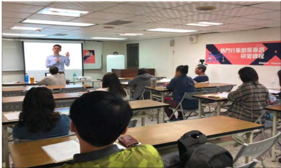
創業熱門行業創業專題研習課程上課情形

2020 年開辦 20 班次創業熱門行業創業專題研習課程、辦理 5 家企業之個別化創業協助方案。2021 年 1 月至 11 月開辦 22 班次熱門行業創業專題單元式課程、辦理 4 家企業之個別化創業協助方案。