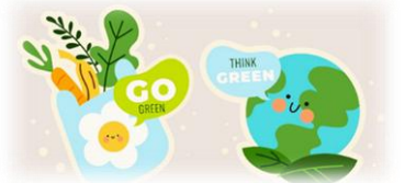
本會近 3 年辦理指定採購環保產品項目執行情形

依據環境部綠色生活資訊網統計資料顯示，113 年本會執行綠色採購「指定採購項目」（共 47 項）結果，採購環保標章產品金額計 6,193,406 元整，占採購總金額（6,193,406 元）之比例為 100%，已達環境部所訂年度績效目標值（95%）。另本會近 3 年辦理指定採購環保產品項目執行情形如附表，均達成目標。