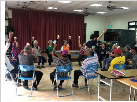
臺東縣卡拿吾部文健站-計畫負責人帶領長者做認知遊戲