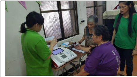
花蓮縣和平文健站-照服員幫長者量血壓