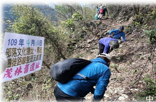
高雄市茂林區公所執行茂林舊遺址維護