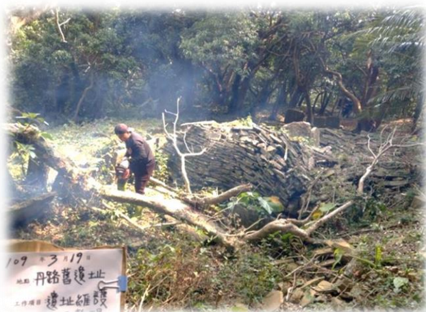
屏東縣獅子鄉公所執行丹路舊遺址維護