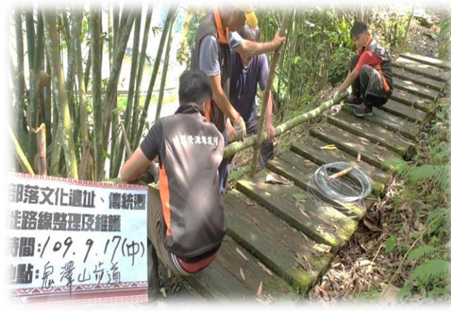
新竹縣五峰鄉公所執行鬼澤山古道維護