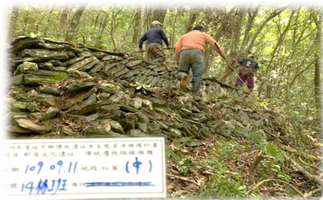
臺東縣延平鄉公所執行胡家遺址維護