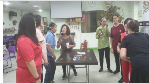
新竹縣山光文健站-口腔訓練遊戲