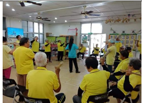
臺東市馬當文健站-照服員帶長者做報紙拍打操