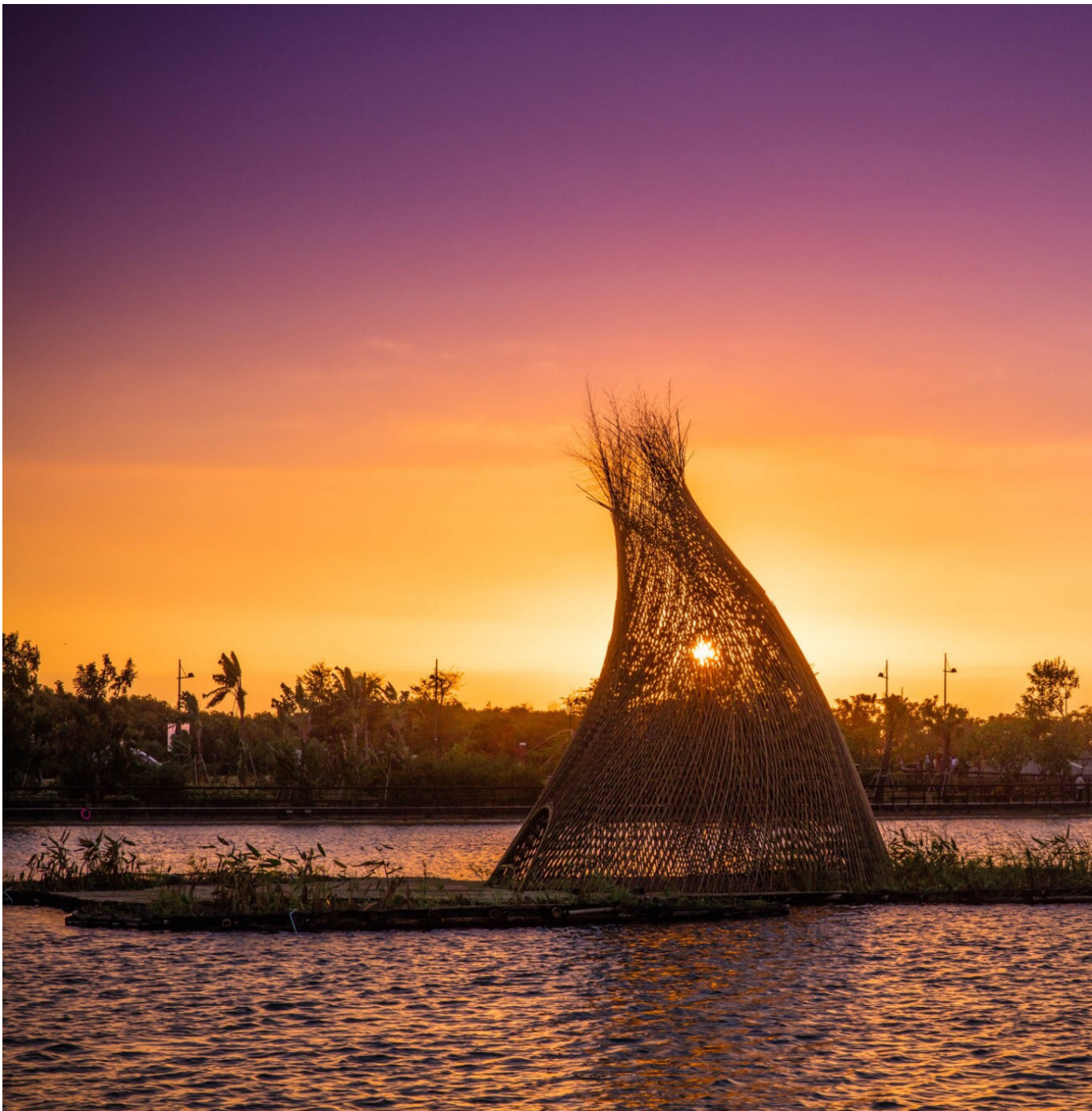
■ 故宮戶外美術館作品呼應南院廣大的水域空間