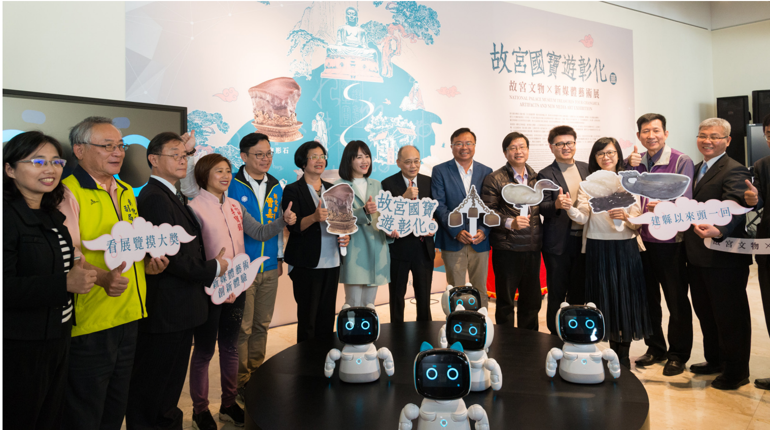
■ 與各地方文化場館合作落實美感教育