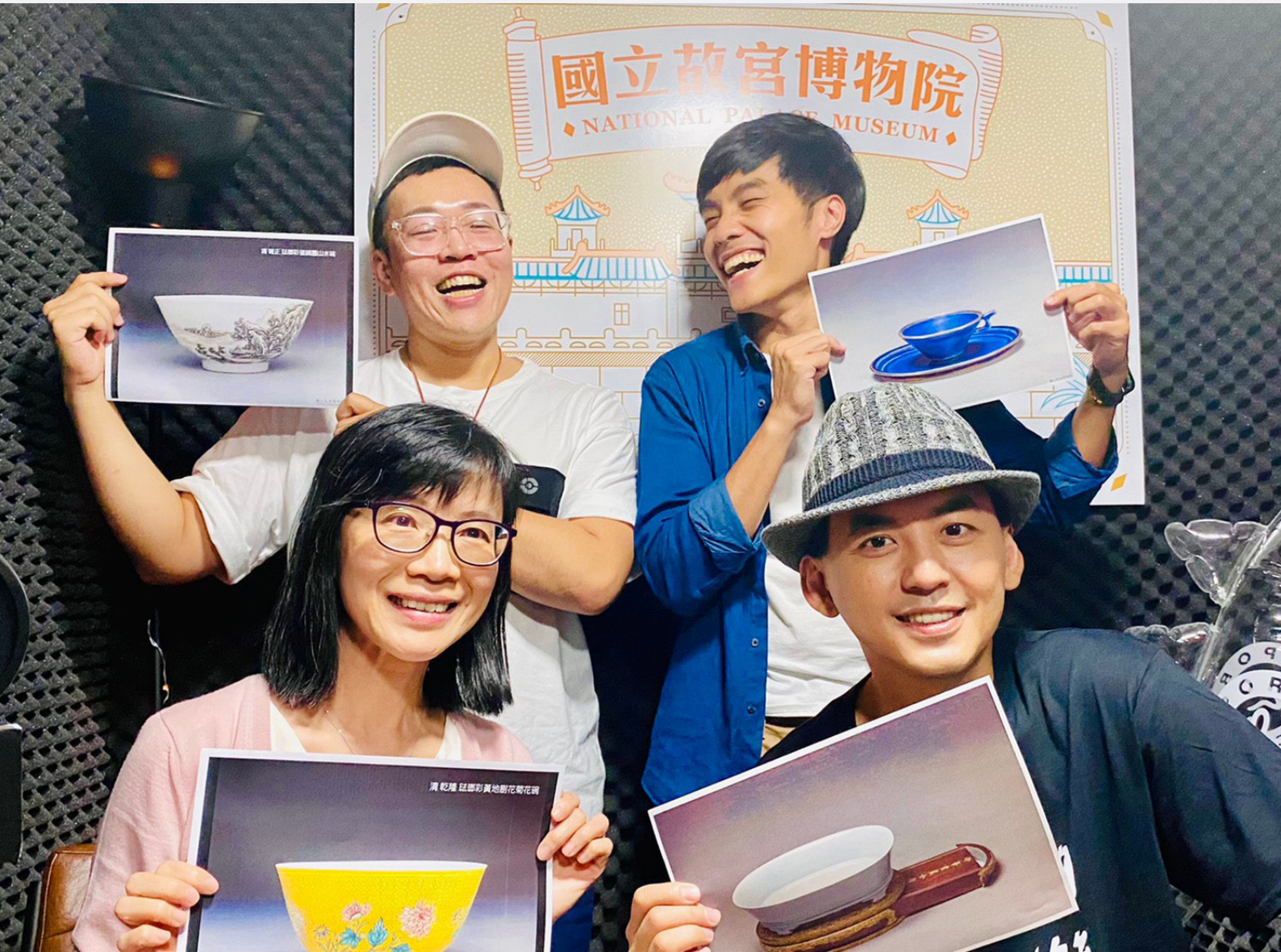
國立故宮博物院 Podcast 深受聽眾喜愛