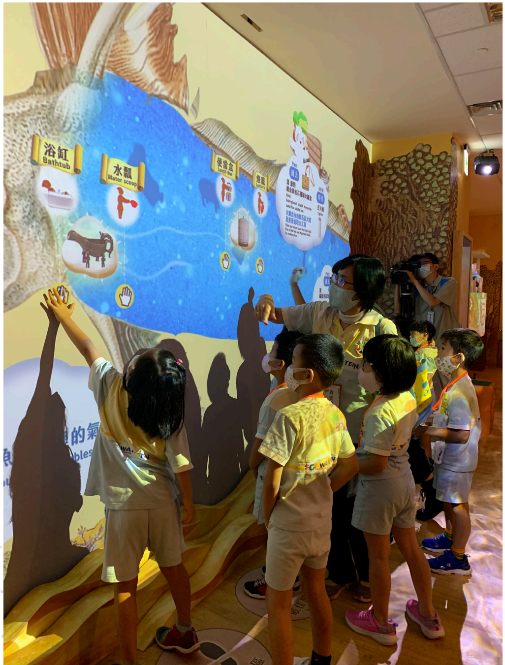
■ 兒童學藝中心展廳升級