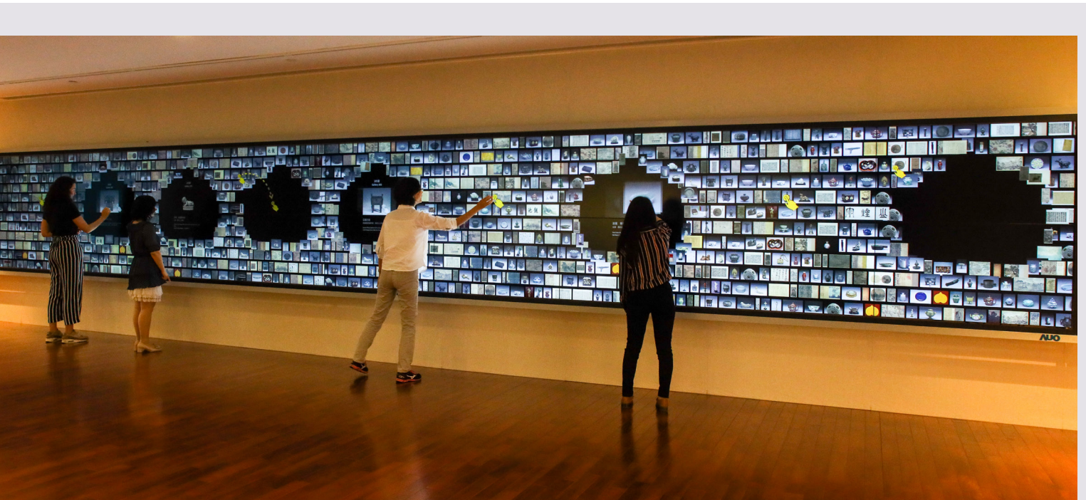
■ 南北院區導覽大廳均以直覺友善的科技界面供觀眾探索