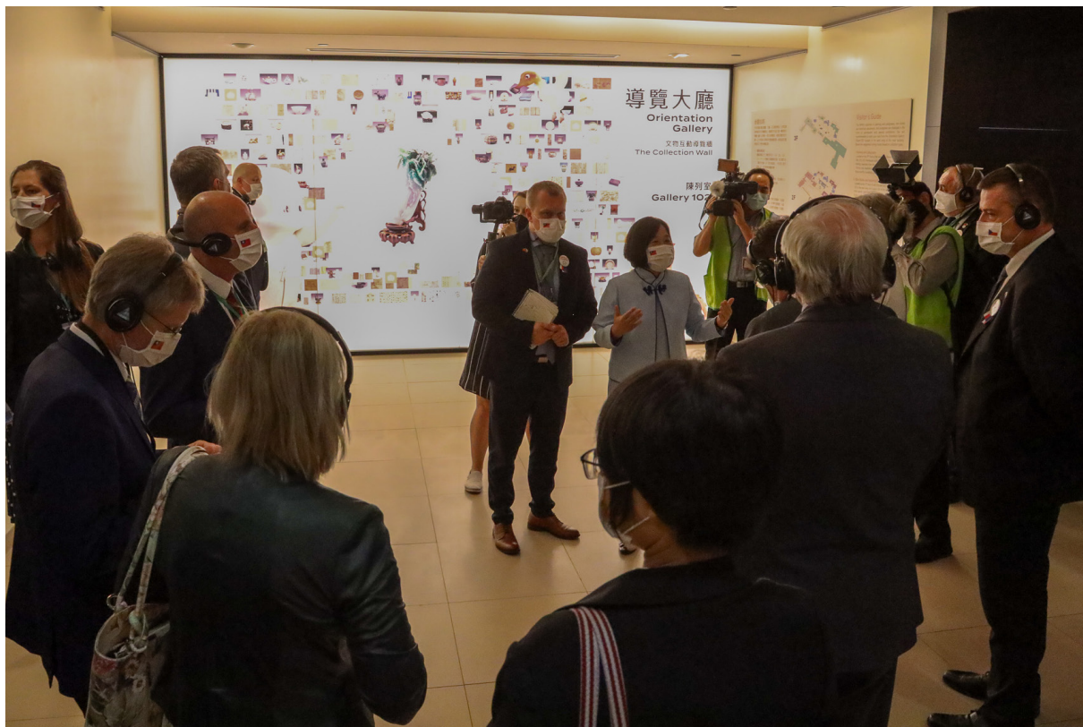
透過國際交流實體活動發展全球夥伴關係