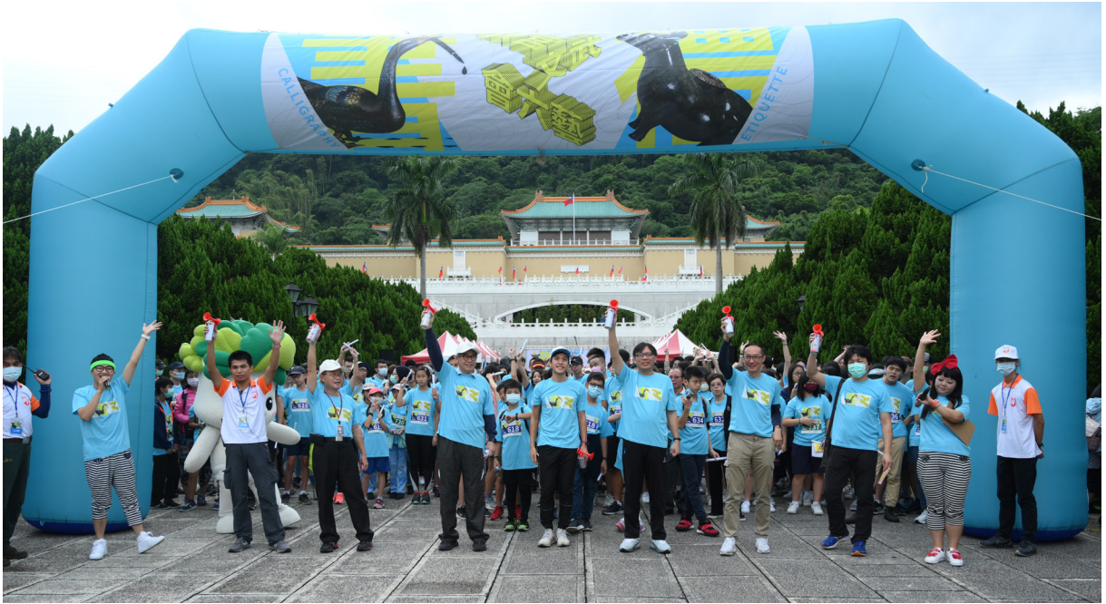
「故宮文武會六藝一定向體驗」邀請喜愛定向運動之族群親近文物