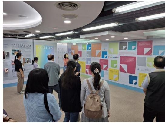
114年5月27日「翻轉、前行、行動-性別平等與永續發展」教育訓練活動照片