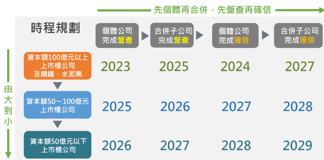
(圖 1：上市櫃公司永續發展路徑圖時程規劃)