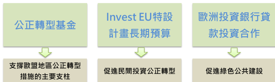
圖 3. 歐盟公正轉型機制