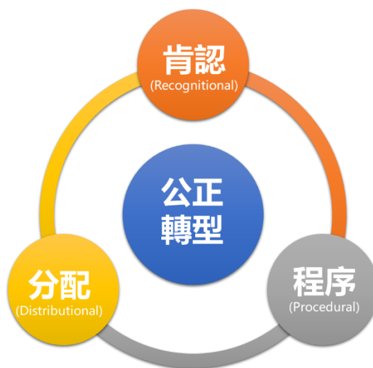
圖 2. 公正轉型概念包含之三大要素

隨著公正轉型概念變的越來越流行，世人對其含義的困惑也有增無減。明確公正轉型概念，可以提供關於正義（justice）的整合性、整體性觀點，有助確認解決環境與經社問題的系統性解決方案。目前國際社會普遍提到的淨零公正轉型概念的三大要素分別為肯認正義（recognitional justice）、程序正義（procedural justice）及分配正義（distributional justice），說明如次：